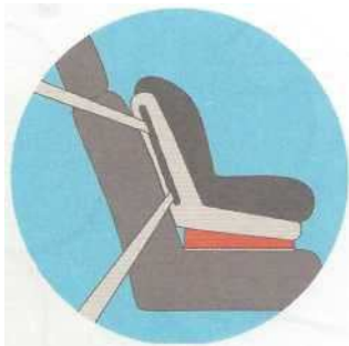
Лицом по ходу движения

Самое безопасное место для установки детского кресла в автомобиле — среднее место на заднем сиденье. Самое небезопасное - переднее пассажирское сиденье. Туда автокресло ставится в крайнем случае, при обязательно отключенной подушке безопасности.