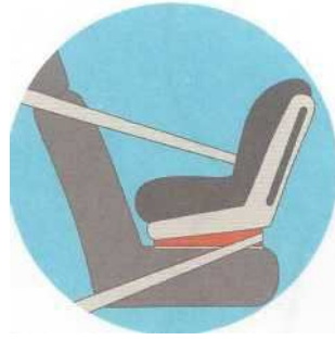
Лицом против движения